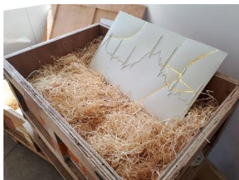
Zorka LEDNÁROVÁ, Ze série Just a Moment I-III, 2019